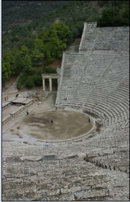
Divadlo v Epidauru