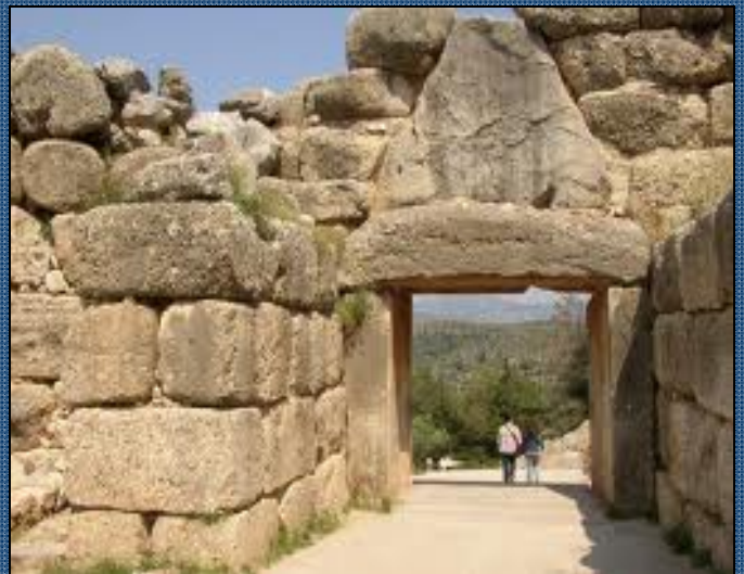
Mykény – Lvi brána

Na cestu vezměte dostatek vody, pohodlnou obuv. Pro ty, kteří absolvují výstup na pevnost, doporučuji pevnou obuv.