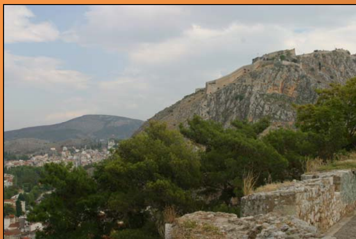
Pevnost Palamídi v Náfpliu